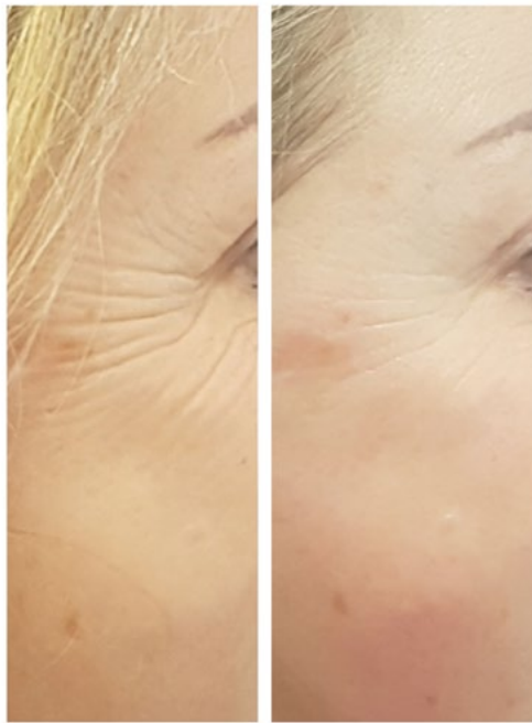
1 séance Soin visage anti-rides