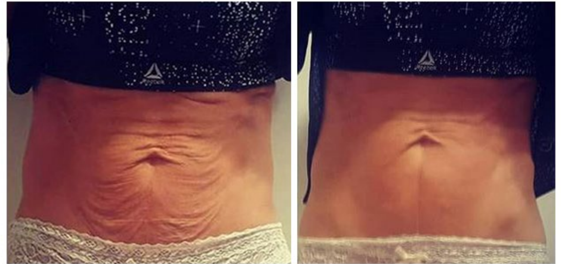
1 séance Raffermissement • Les fées du bien • SIX-FOURS