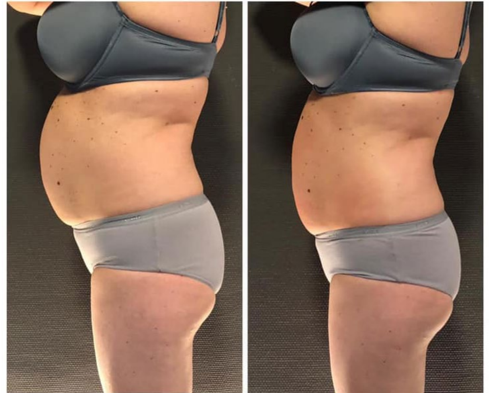
1 séance Arctik - Cryostretto • MEERHOUT