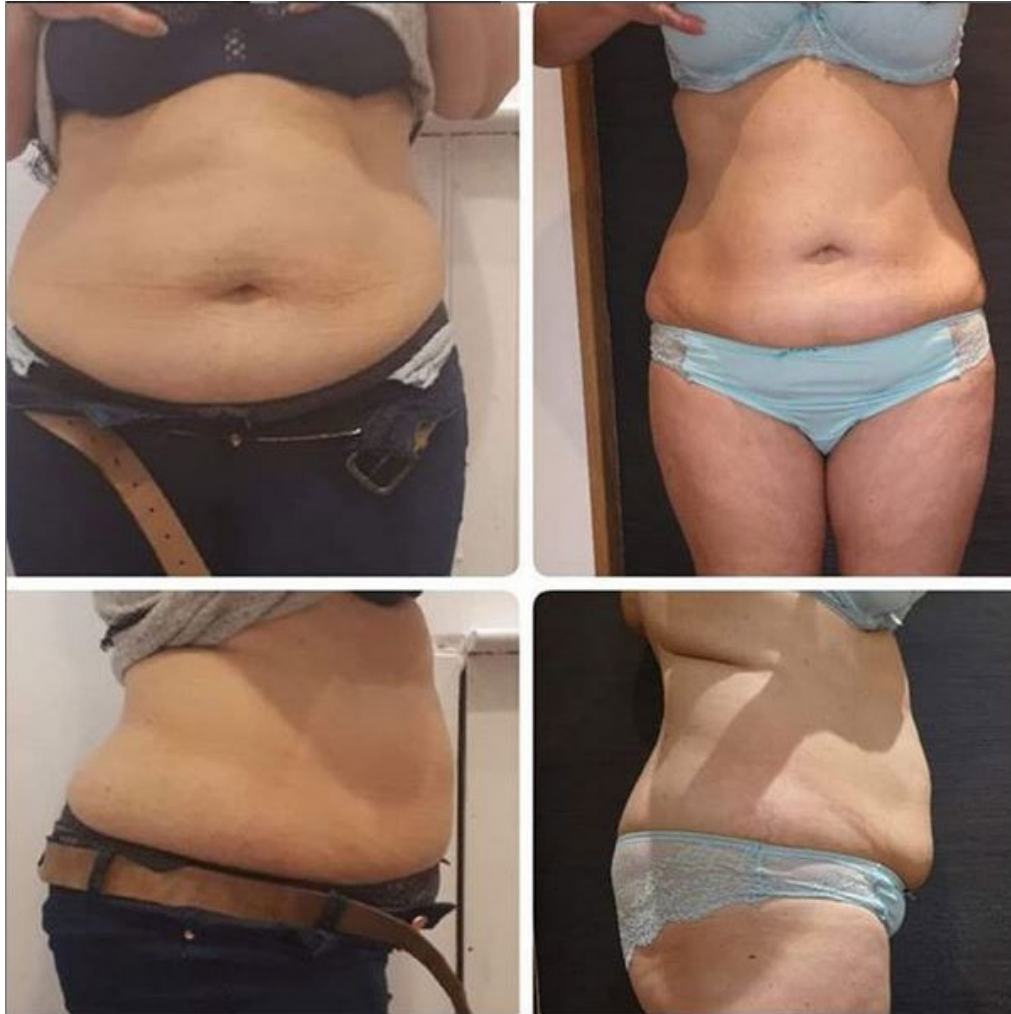
Cure de 10 séances Amincissement Le temps d'une pause • ROUEN